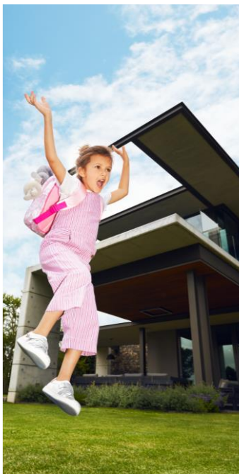
fot. CCC, kolekcja SS'20