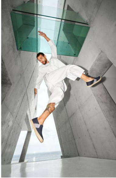
kolekcja SS'20